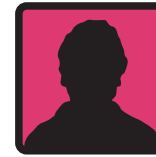
Ministère de l'intérieur