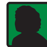
Chef d'équipe éducative