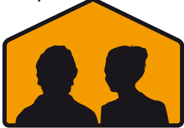
مراقبت کننده (های) پرورشی