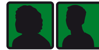
مدیر گروه کاری