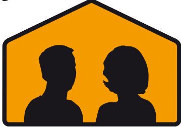
مراقبت کننده (های) حمایتی