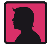
مسنول حقوق کودکان