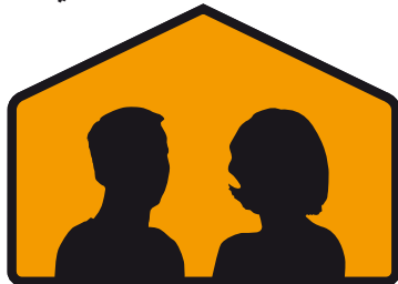
ملاتړ شوي ساتونکی (ساتونکي)