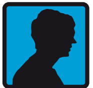
د مشوري کارکوونکی