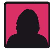
د دوسې مشر