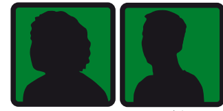
د تجربې د ټيم مشر سوشل ورکر