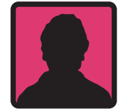
Ministère de l'intérieur