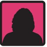
Chargé de dossier