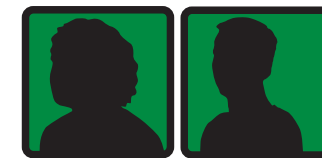
Chef d'équipe éducative